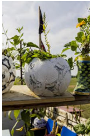
Früher Fussball – heute Pflanzentopf