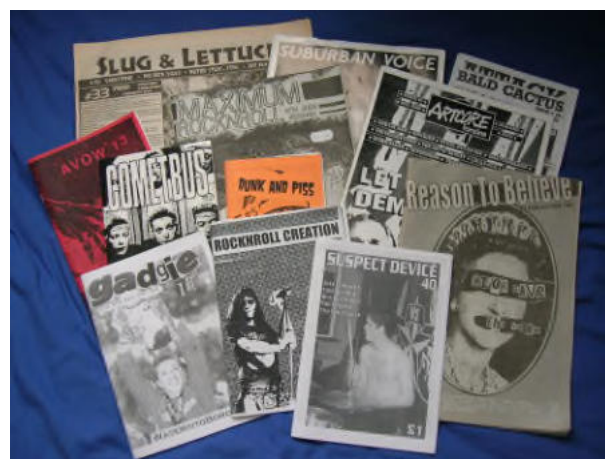
Collagen-Zines aus den USA und Grossbritannien