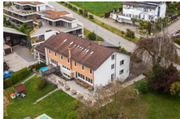
Stein am Rhein