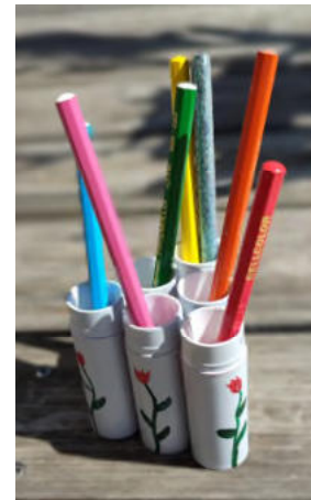
Aus Leimstift wird Stifthalter