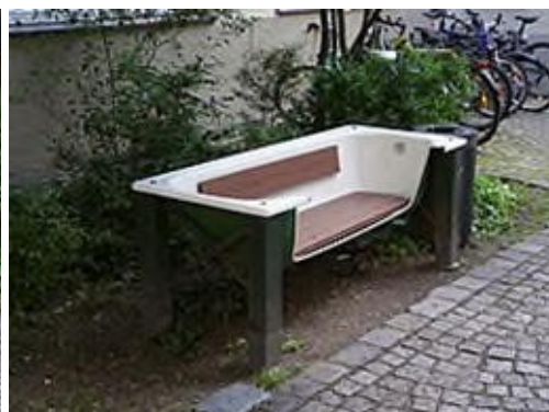
Wo einst gebadet wurde, kann nun gegessen werden.